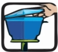
Mantenha a caixa d'água sempre fechada com tampa adequada.