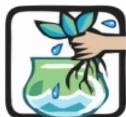
Se tiver vasos de plantas aquáticas, troque a água e lave o vaso principalmente por dentro com escova, água e sabão pelo menos uma vez por semana.