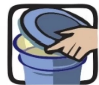
Mantenha bem tampados os tonéis e barris d'água.