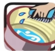
Lave semanalmente por dentro com escovas e sabão os tanques utilizados para armazenar água.