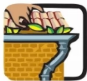
Remova folhas, galhos e tudo que possa impedir a água de correr pelas calhas.