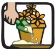
Encha de areia até a borda os pratinhos dos vasos de plantas.