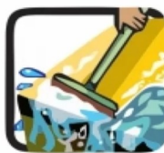
Não deixa a água da chuva acumulada pela laje.