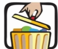
Coloque o lixo em sacos plásticos e mantenha a lixeira bem fechada. Não jogue lixo em terrenos baldios.