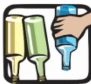
Guarde garrafas sempre de cabeça para baixo.